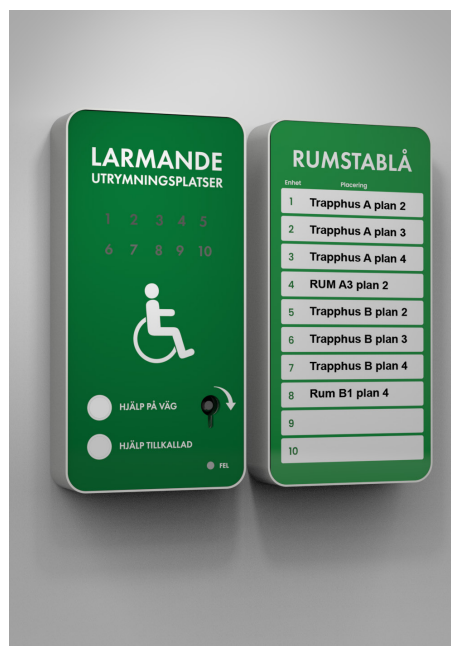
Larmpanel i standbyläge