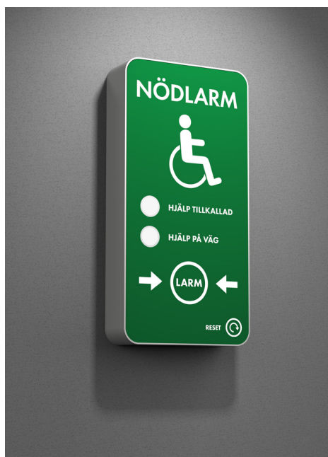
Nödstation i standbyläge